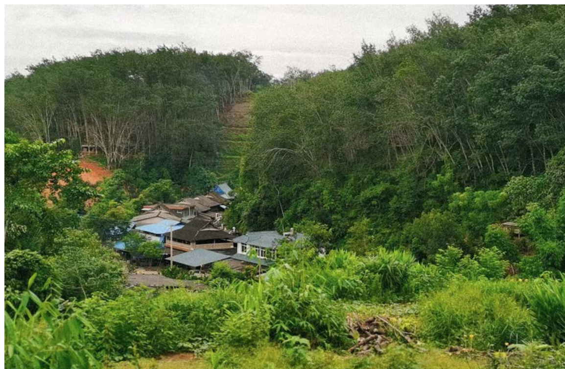
巩丙新村周边的橡胶林

水土保持功能下降，水源减少且水质变差，尤其是旱季，饮用水不足已成为主要问题，这也是橡胶种植区村寨普遍存在的问题。此外，大量使用除草剂，不仅对饮用水安全造成威胁，还导致阿卡人村寨传统房屋所需的茅草无法生长。山林遍种橡胶树也导致许多阿卡人经济上高度依赖此单一作物，巩丙新村全村 70% 以上的收入来源为橡胶，粮食和饮用水大多依赖外部购买。