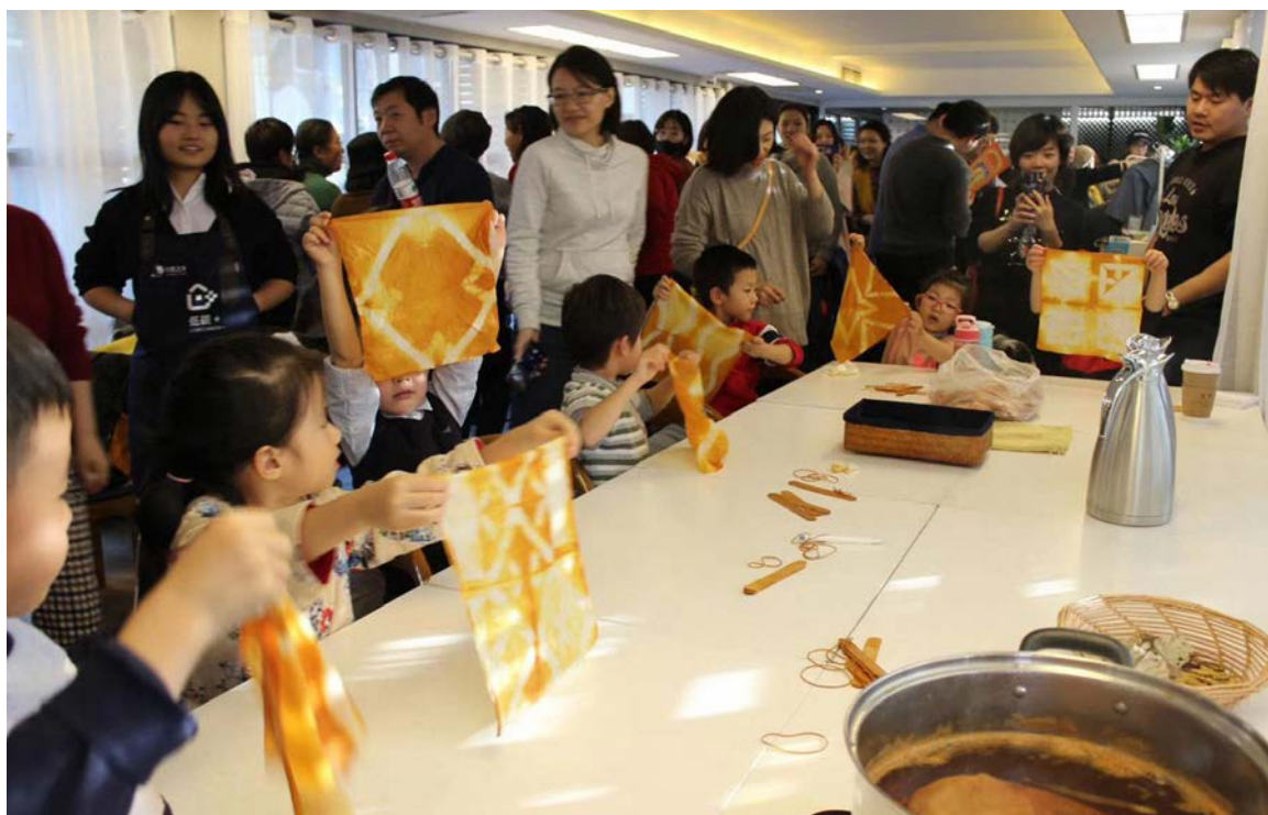
下：厨余染工作坊以洋葱皮为材料，让孩子们亲手染制自己的手帕

社区伙伴相信，绿色社会和美丽中国的实现不仅需要靠顶层设计和政策推进，还需要落实到具体的个体与社区、社群的日常生活中；依靠可持续生活实践者的意识和行动转变，社会改变才能焕发持久的生命力。这也是社区伙伴与零活实验室同行的初衷。