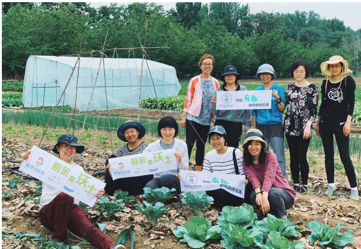
上：在北京郊外的小柳树农园，零废弃生活社群共同亲近土地，了解食物来源

加入社群时，群友对零废弃和可持续生活的理解及实践程度不尽相同，在相互分享和启发的过程中，意识层面也会发生转变。经验梳理的过程也增进了群友对“零活”理念的深层次理解。有群友分享说：“实践零废弃生活以后，我开始慢慢对自己的生活追根溯源，对物品追根溯源，发现它最后会回到大地，也会回到源头上。其实，我也没有想着要影响很多人，能影响一个是一个……这个社群也像是土壤，开放和包容。”