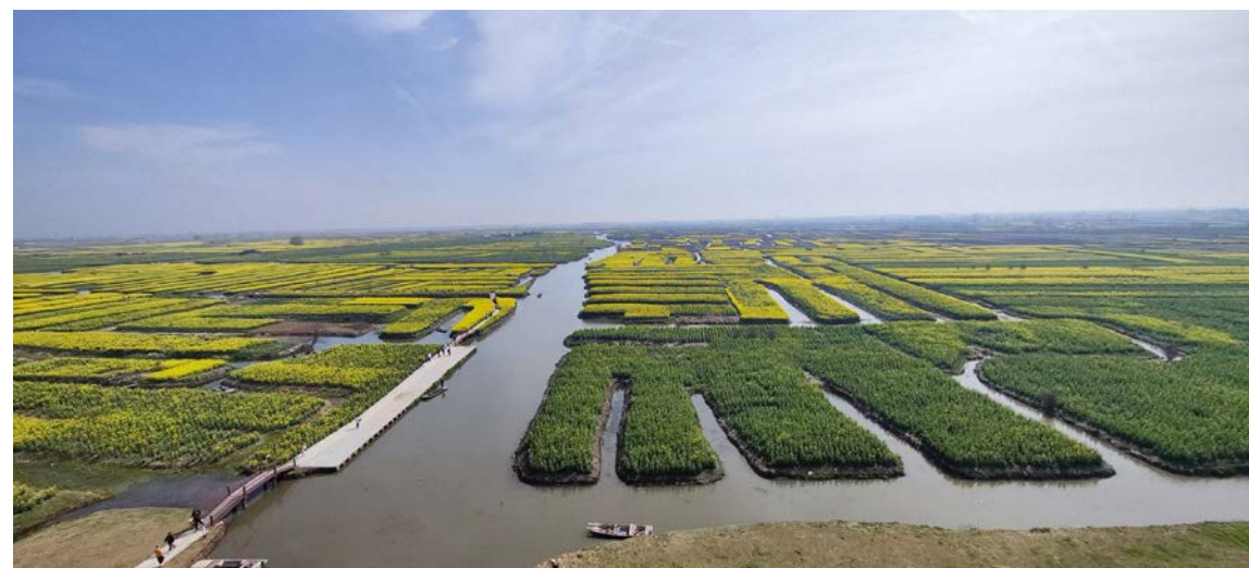
兴化传统垛田与当地水网交织

依据《生物多样性公约》的解释，生物多样性包含遗传多样性、物种多样性和生态系统多样性三个层次。中央民族大学项目团队的研究聚焦于农业遗传资源的就地保护，并且推动公正和公平分享利用遗传资源所产生的惠益。随着研究的深入，项目团队愈加认识到，传统知识与乡土文化所保护的并不限于老品种，同时也保护着多样性的生态系统。中国拥有悠久的农业文明，各族人民在与