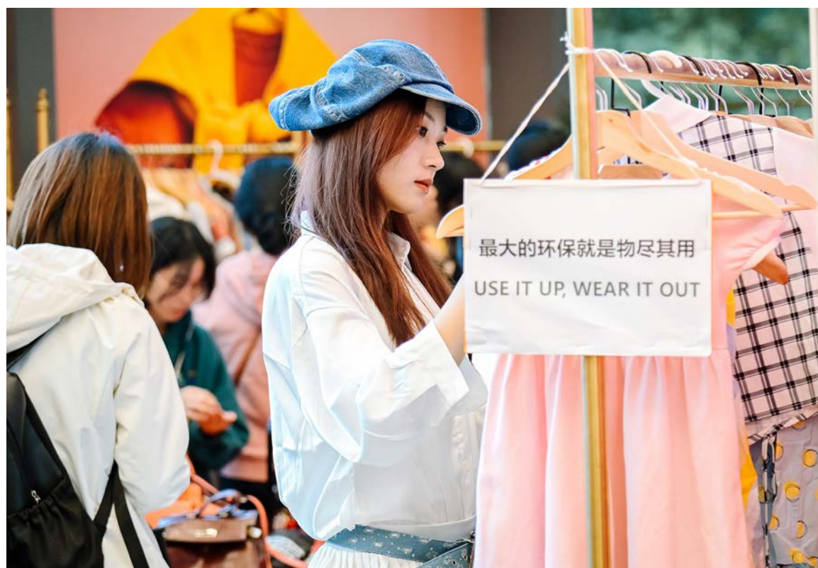
商场里的“旧物新生”活动

零活实验室在社区伙伴支持下开展的一项调研表明，群友加入零活实验室后，在意识和行为上都有不同程度的改变，将近 40% 的群友开始尝试零废弃实践，超过 34% 的群友已经养成了一些零废弃习惯；约 13% 的群友已经较为稳定地进行可持续生活实践。这些实践体现在衣食住行各方面，包括参加二手衣物交换、垃圾分类、厨余堆肥、随身携带餐具和水杯、只购买必需品等。与此同时，群友对可持续生活方式的理解也更为深入。有群友分享说，可持续生活就是“以谦卑的姿态看待自己对世界造成的负担，努力减少不必要的消耗和破坏，给动植物留出生存空间，学会与自然和谐共存，而非放任挥霍。”