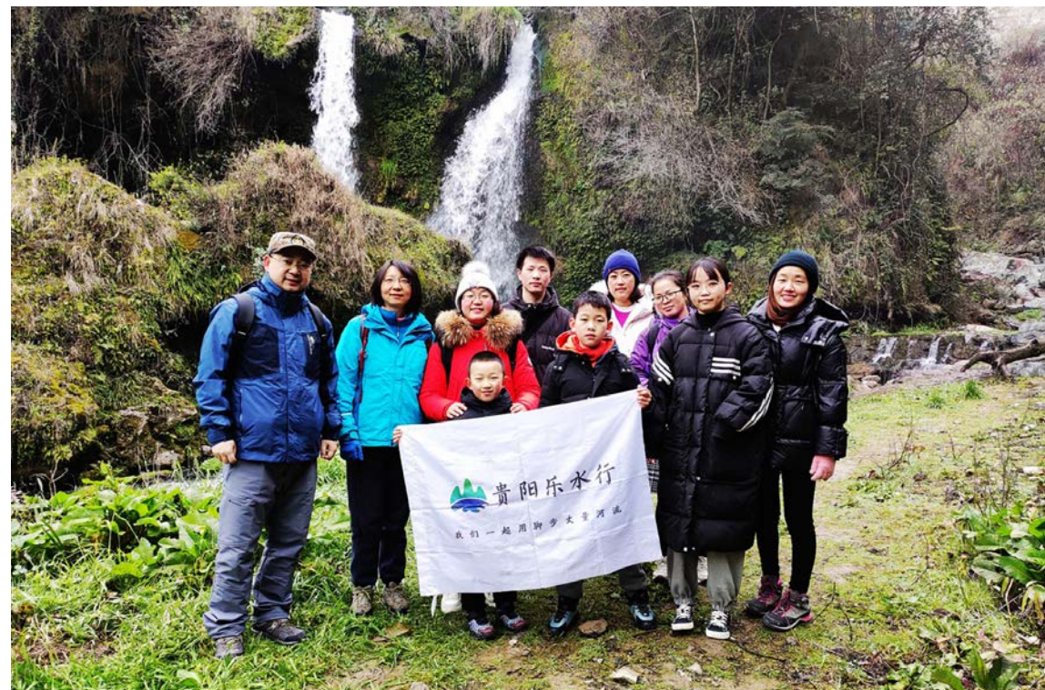
社区伙伴代表与领队一起参加贵阳乐水行活动

为探索环保骨干人才培养的新视角及方法，带动公众持续深入开展环保活动，黔仁生态于 2021-2023 年与社区伙伴合作开展“贵州水环境保护骨干力量培育计划”，在贵州省内招募和遴选巡河领队，依托“贵州巡河领队能力成长特训营”，通过主题工作坊培训、行动实践和互助共学等方式，持续深度陪伴骨干志愿者群体成长，提升其生态文明意识以及带动公众开展水环境保护活动的的能力，更好地参与构建生态环境治理全民行动体系。