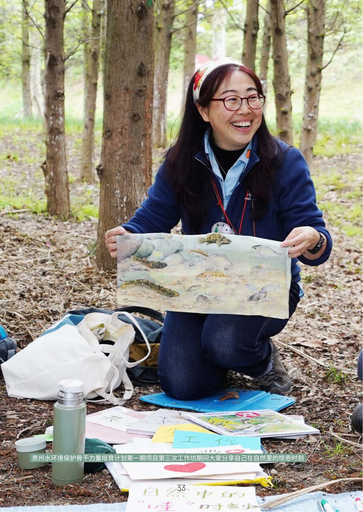
贵州水环境保护骨干力量培育计划第一期项目第三次工作坊期间大家分享自己在自然里的惊奇时刻

源于对“人”的看见和重视，黔仁生态不仅在机构层面对领队骨干给予整体性支持，也通过其他项目延展和深化与领队的联系，契合了人才培育项目对“长期性”陪伴的需求。为此，2023年12月社区伙伴与黔仁生态开始了第二期骨干培育项目。可以说，通过与社区伙伴的共同探索，黔仁生态对人的成长更为关注，其所构建的志愿者骨干网络也因此更加血肉丰满，更有生命力。