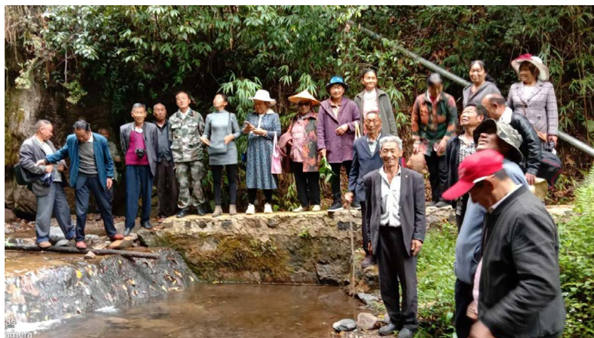
永安社区老年协会组织村民开展水资源调查

腾冲历史上是西南地区的文化中心之一，诗书传家，礼仪育人，当地社区对文化十分看重。作为文化传承的重要力量，老年人在社区中的地位非常高。在外就业的老人退休之后返回老家做公益，历史上已经蔚然成风，也被认为是一种重要的自我实现途径。有些社区成立了老年协会，擅长组织公共活动并提供社区治理服务，成为当地最富有活力的民间草根组织。除此之外，村委会和传统组织也是带动社区的重要力量。