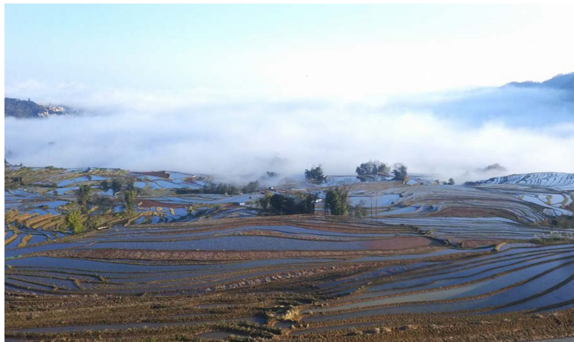
哈尼族在长期的梯田农耕生产中培育了上千种传统稻谷品种

从 2012 年开始，中央民族大学项目团队在云南、广西和贵州三省选取了涵盖 12 个民族的 32 个村寨，实地调查每个村寨的农作物传统品种的历史变化和保存现状，了解农作物品种保留和消失的原因，农民对农作物传统品种的保护和发展的态度等问题，以摸清我国民族地区农作物遗传资源的保留现状，探讨农作物遗传资源就地保护的影响因素。此外，还对就地保护与异地保护条件下的农作物遗传多样性开展对比研究。