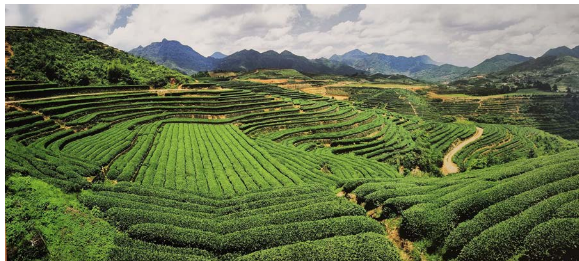
保靖黄金茶古茶园

项目团队对垛田的传统知识体系及其生态学原理开展研究，挖掘其中的技术内涵和生态智慧，试图从系统视角去理解兴化垛田对生物多样性保护的价值。垛田复合系统在空间与时间维度上充分利用自然资源，形成物质的多级循环利用，在提高能量转化率和系统生产力的同时，有利于构建完