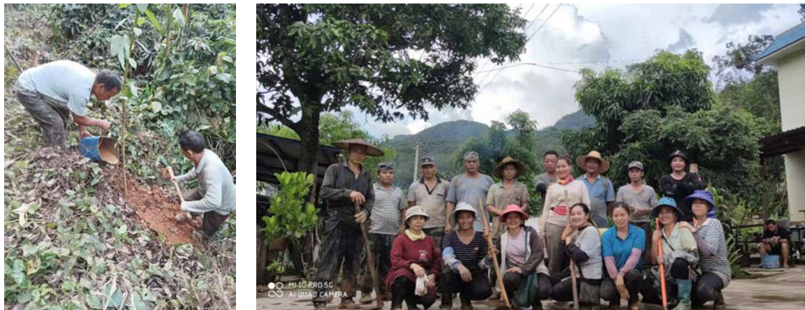
左：巩丙村民砍伐橡胶树后，开始恢复雨林，种植兼顾生态、文化、景观等需求的树种 右：巩丙村民种树归来

关，通过讨论传统植物利用及其重要性、相关植物的现状以及保护和恢复计划等，有助于让村民重新思考生态和文化与现实生活的关系。比如妇女提到的传统药用植物刺苞老鼠筋，如今在很多阿卡人社区及周边都消失了，外村人都到巩丙新村索要。在讨论 60 亩山林的恢复方案时，有的妇女就提出要在那里种植刺苞老鼠筋。巩丙村民一直引以为豪的阿卡饮食文化中，也涉及大量物种及相关传统知识，尤其是家常、待客或是节庆都少不了的野菜，更是老中青村民尤其是妇女乐于谈论的话题。为此，村民提出，希望整理与植物相关的传统知识，为生态恢复及村寨生计提供参考。