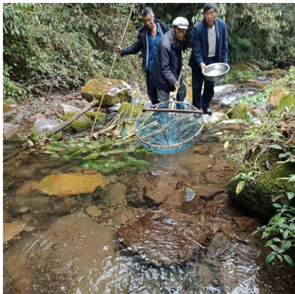
大塘社区老年协会成员巡河观察鱼苗情况