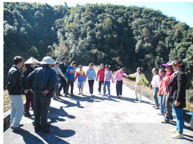
下：腾冲分局和大塘老年协会合作，在大塘社区开展关注自然、保护鸟类宣传

在永安社区，舞龙灯是令当地人骄傲的记忆，但随着老艺人过世已中断多年，社区一直希望能够恢复这项传统。尽管舞龙灯和生物多样性保护没有直接关系，腾冲分局和社区伙伴仍然支持这个提议，希望由此增强社区凝聚力。从团队组建开始，到重新学习龙灯制作技术、练习耍龙灯和鼓乐伴奏，再到最后走村串寨舞龙灯的整个过程，前后有男女老少百人以上参与，不仅重新粘合了社区人与人之间原本疏离的关系，也让代际文化传承有了新的载体。腾冲分局认为，此类活动有助于激发社区的共同体意识，培养年轻一代与这片土地的情感连接，从而激发出责任心和使命感，最终成为保护的内在动力。