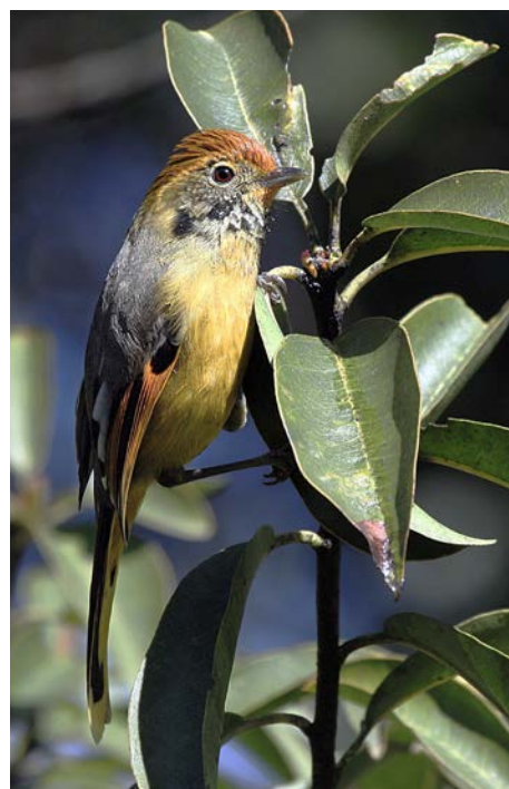
左：斑喉希鹛等鸟类也受到大塘社区的保护，村民认为，自然万物息息相关，只有保护好山林和鸟兽、昆虫等，才能最终保护好鱼类

以社区为本，意味着尊重社区长久居于此地的主体地位，意味着相信社区识别和解决问题的能力。尽管是聚焦于生物多样性保护的项目，也需要首先沉下心来去理解社区的整全样貌，明晰社区真正关注的问题，在此基础上寻找社区与保护之间的关联。