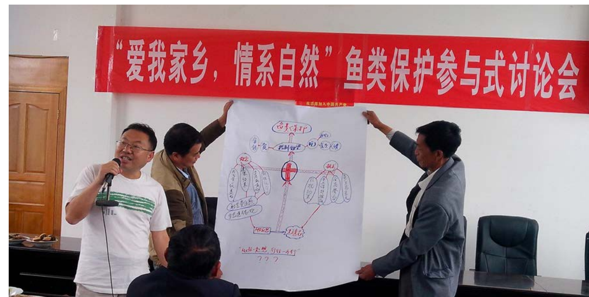
腾冲分局、社区伙伴和大塘社区合作举办鱼类保护讨论会

与这一切变化同时发生的，还有腾冲分局对生物多样性保护工作观念和做法的改变：从最初的“孤岛式”保护转变为社区为本的保护手法；从刚开始不理解社区伙伴拒绝资助硬件设施，到认同非经济动力、以传统文化为根基的保护理念；从强调社区保护责任，向村民灌输生物多样性知识，教村民怎么做，到和村民一起做，再到陪着他们做，走过了从主导者到协作者的过程。