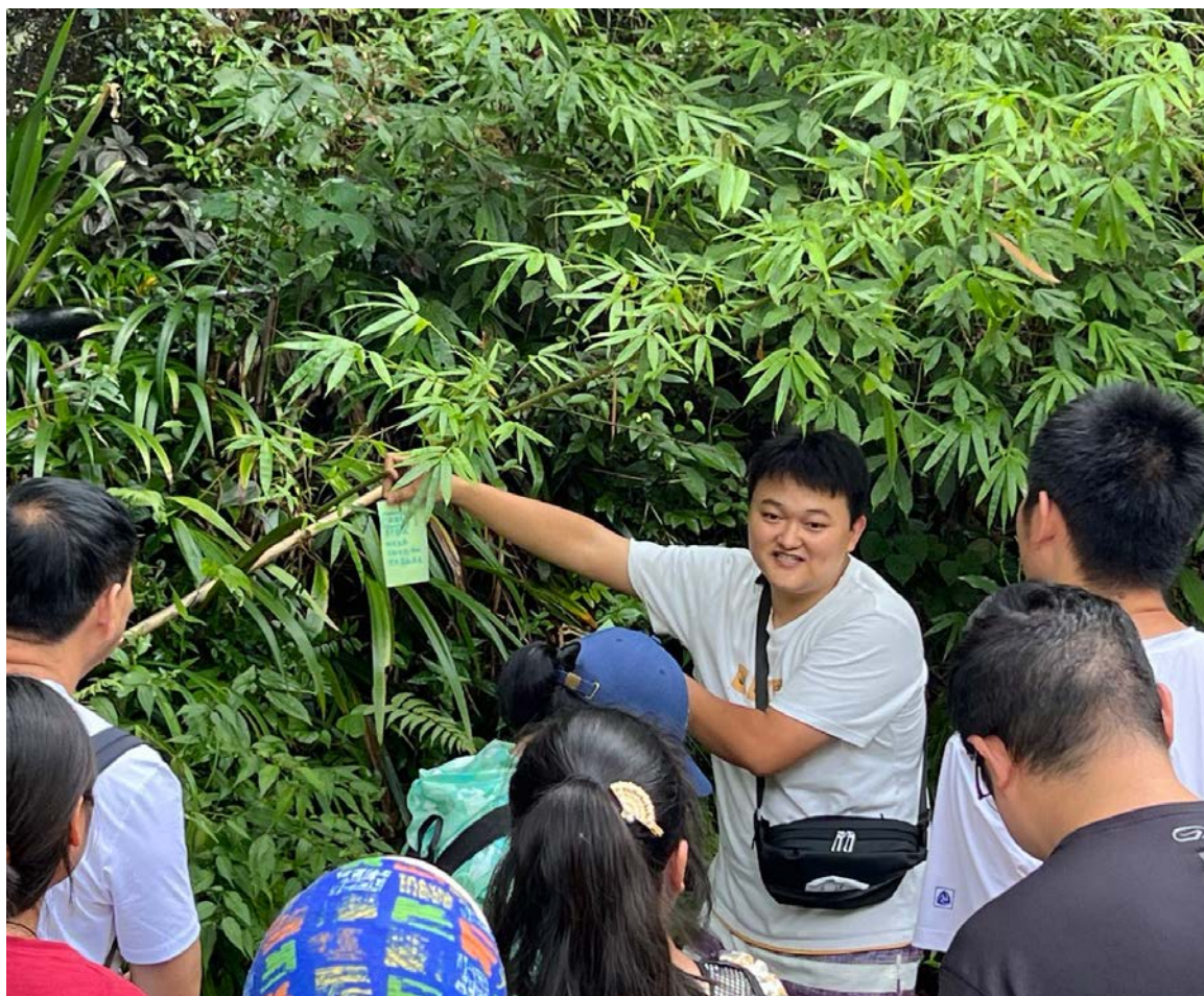
巡河领队开展户外学习实践

有了内在动力，还需要提升领队的专业能力，使其发起和带领的水环境保护活动更有效、更具吸引力；活动的成功开展又会增强领队的自信心和成就感，进一步激发其动力。为此，项目以提升领队的团队沟通协作与活动带领能力为重点，通过体验式学习，提升领队的倾听、表达、反馈等沟通技巧，学习如何在环保行动中促进团队联结感、增强团队凝聚力与行动力。同时，以提升领队的活动创新设计能力为重点，协作领队掌握基本的活动设计思路，学习根据自身志愿者伙伴网络的特点以及不同在地资源创新设计水环境保护活动方案，并组织实施。领队普遍反映，通过参与项目，专业技能得到了不同程度的提升，活动设计与执行能力的变化最为显著，个人领导力、自信心也大为增强。