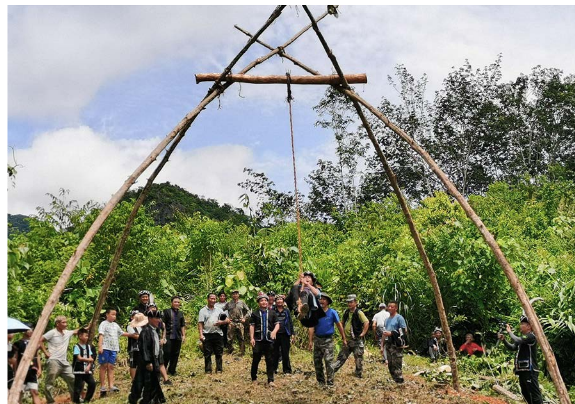
巩丙村民为耶苦扎节新立的秋千

除了巩丙新村，还有许多地方正在探索文化多样性与生物多样性相互依存之道。正如项目团队在总结时所说，这些探索可能是在很小的地方发生，只是很多很小的点，但慢慢就会连成一个面，“最终达到人和自然、人和人关系的和谐”。