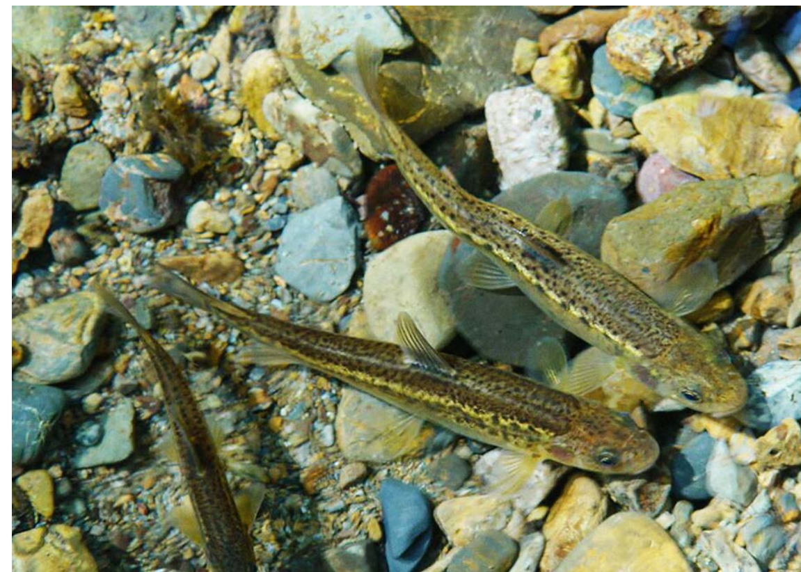
仅存活于高黎贡山低温河水中的珍贵鱼类——全裸裸重唇鱼，当地俗名“冷水花”，是大塘社区的重点保护对象

尽管村民逐渐意识到传统文化与生物多样性保护息息相关，但明白这些表层关系，还无法形成社区持久参与保护的内在动力，我们需要与村民共同探讨和提炼出文化表象之下的底层价值，才可能激发当地社区的文化自觉，从而带来持续性的保护行动。为此，腾冲分局不断支持和鼓励社区发掘各自的核心价值。在界头镇大塘社区，通过调查当地历史、民族、宗教和生态文化，梳理传统美德，让村民重新认识到，先辈是用“道德”理念来对待自然万物的，承认众生皆有生存的权利，都需要空间和位置；人不仅要同类有道，对山林河流和鸟兽鱼虫也要有道，有什么样的道，就积什么样的德。生态道德观由此成为大塘社区的核心价值，引领村民修道积德，树立发自内心的保护意识，并落实到具体的森林、鱼类和鸟类的保护行动上。与大塘类似，其他社区也陆续提炼出生态社区、感恩山林、和谐社区等核心价值。