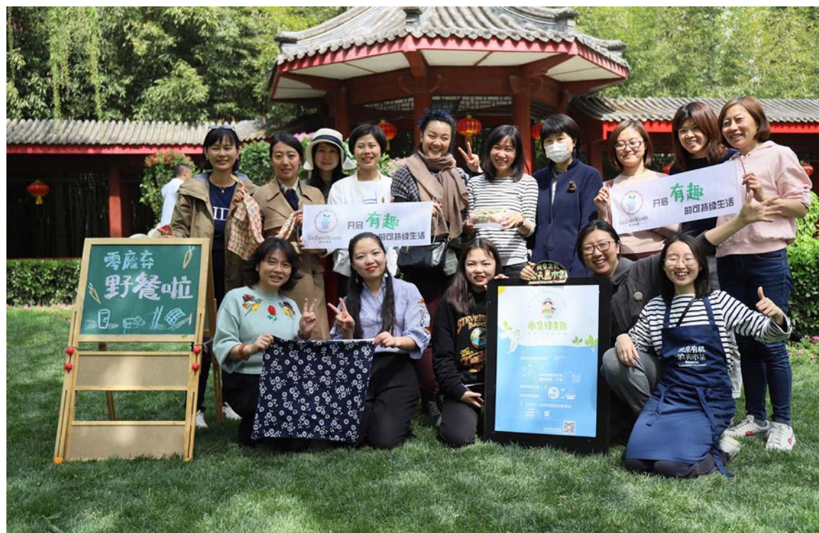
春日中的零废弃野餐，20多人只产生了小小一盒厨余

参与式的经验梳理过程促进了零活社群理念的集体共创，由此生发出的拥有感促使群友更加自发地将之落实到日常实践中。通过调查问卷收集以及线上和线下交流，零活实验室有机会充分聆听群友对零废弃及可持续生活的理解与反馈，在此基础上形成组织架构及机制。与此同时，零活社群也在这个过程中达成了共同的理念和价值观表达，促使成员回看自己加入零活的初心，并从更高、更完整的视角去看待社群发展，理解自身零废弃实践的价值和意义。在调研中，群友对零活实验室的理念及倡导的生活方式多有共鸣，认为“这代表着未来的方向”，并对自己的生活产生了切实的影响。