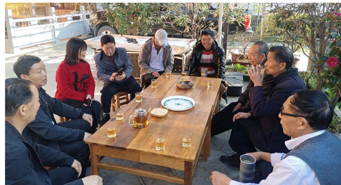
桥头社区的新老村民商讨共同维护社区河流清洁及鱼类保护

涉及与生态保护直接相关的问题，腾冲分局也鼓励社区群众自己分析原因，找到问题的根源。比如，大塘社区在公共讨论中就找到了附近河流中鱼类减少的原因——一方面是自然环境变化造成的，如之前的森林砍伐导致蓄水能力下降，河水量减少；另一方面与道德行为有关，包括灭绝性捕鱼以及污染河流等。公共讨论有助于促进社区内部形成交流、学习的氛围，让村民更加关心和了解社区事务，关心身边的生态和环境。