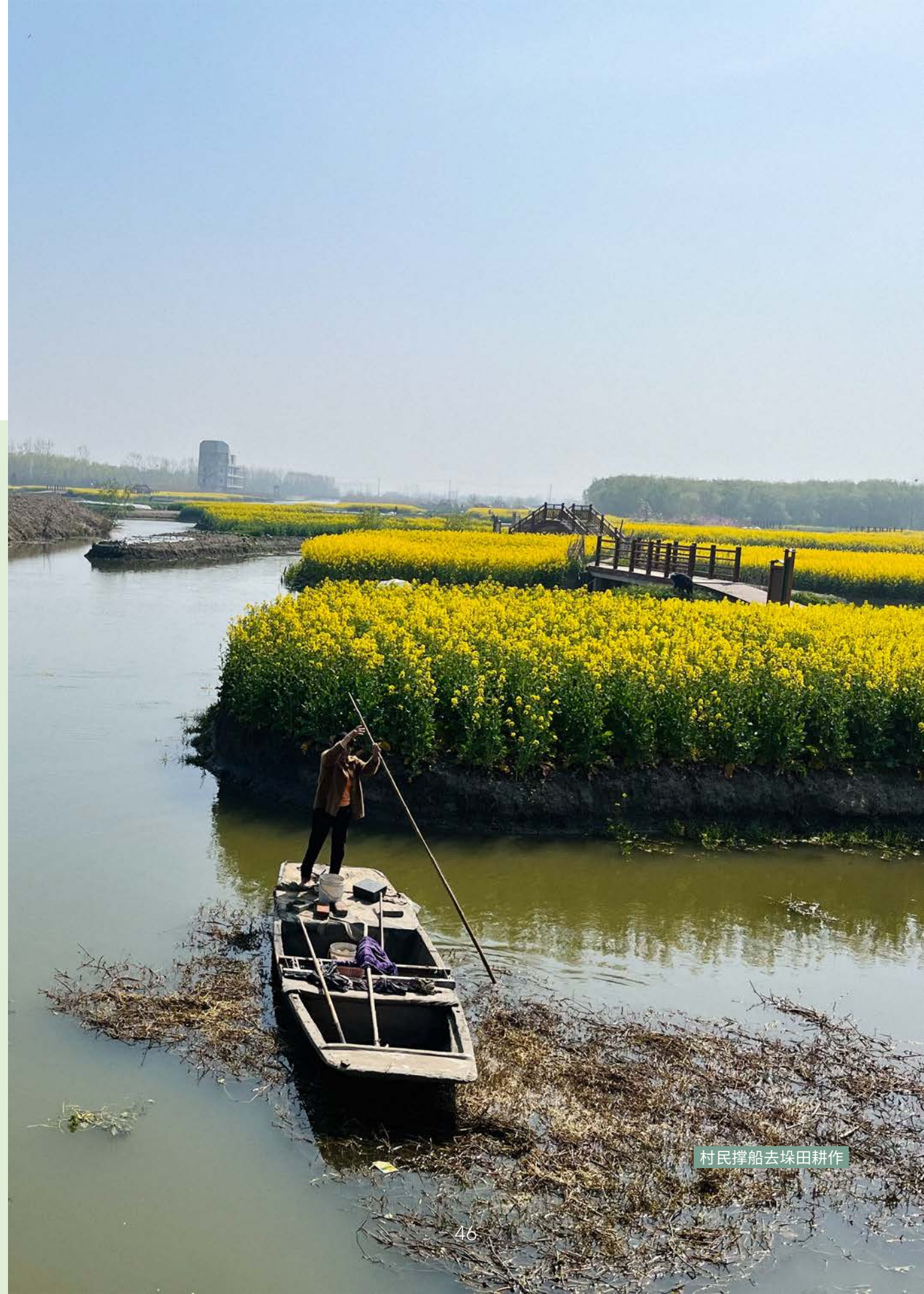
村民撑船去垛田耕作

社区伙伴在多年的工作中也关注到传统文化与农业生物多样性的密切关联，并努力促进二者的协同发展。从2012年开始，社区伙伴支持中央民族大学团队开展农业生物多样性保护与公平及可持续利用的相关研究工作，系统梳理传统知识和乡土文化对于生物多样性保护的价值，探讨在地方实践中如何回应国际公约以及我国生物多样性保护政策，丰富和促进对此议题相关的讨论与行动。