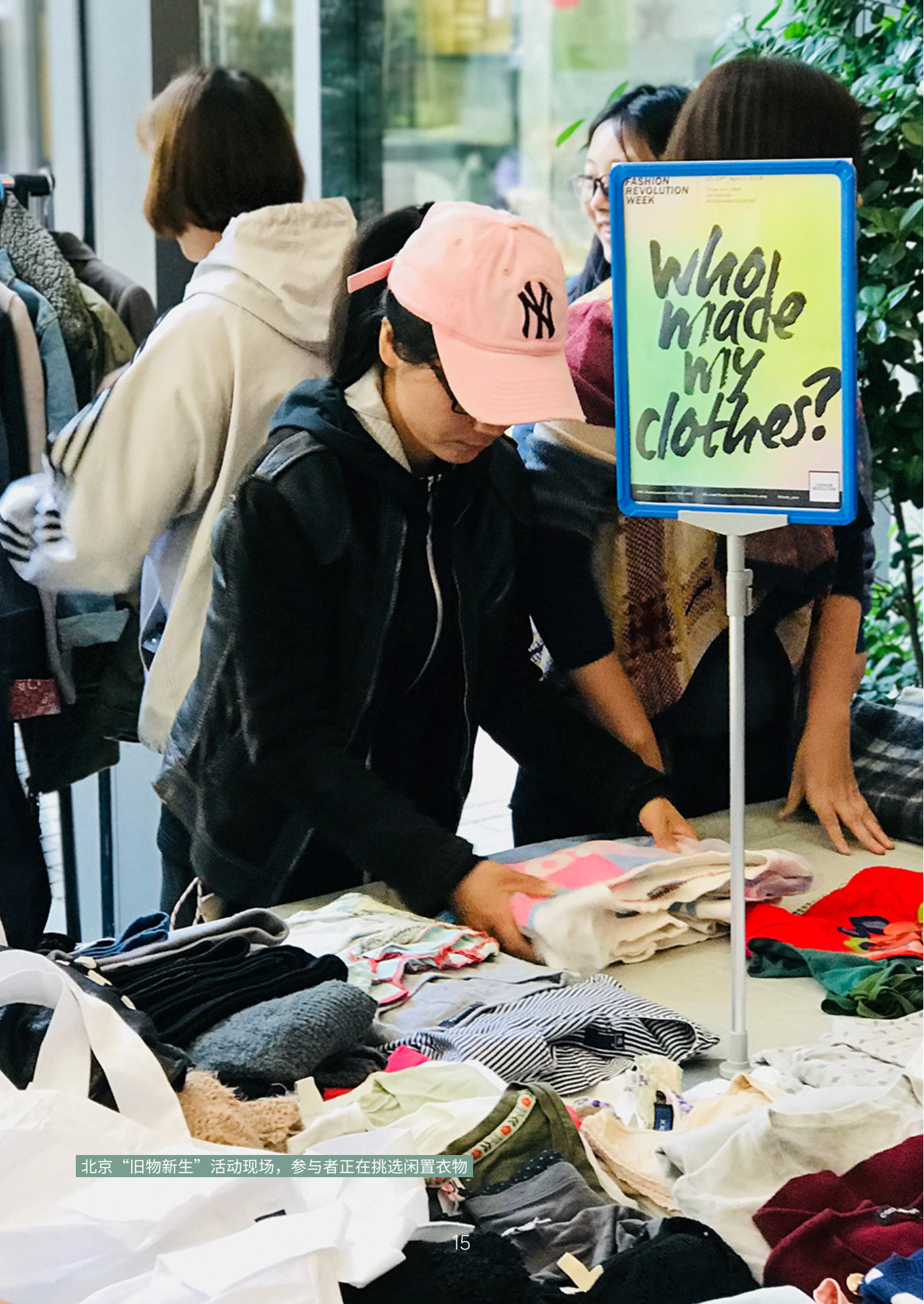
北京“旧物新生”活动现场，参与者正在挑选闲置衣物