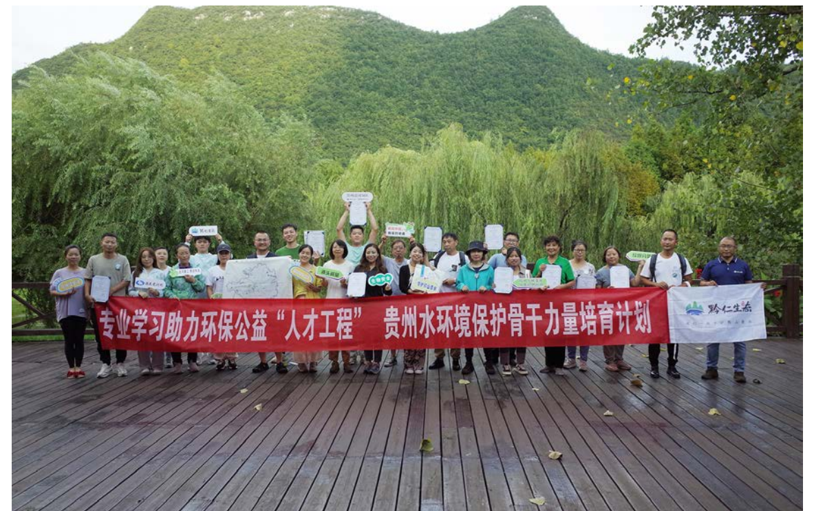
贵州水环境保护骨干力量培育计划第一期项目总结交流会参与人员合影

源于对“人”的看见和重视，黔仁生态不仅在机构层面对领队骨干给予整体性支持，也通过其他项目延展和深化与领队的联系，契合了人才培育项目对“长期性”陪伴的需求。为此，2023年12月社区伙伴与黔仁生态开始了第二期骨干培育项目。可以说，通过与社区伙伴的共同探索，黔仁生态对人的成长更为关注，其所构建的志愿者骨干网络也因此更加血肉丰满，更有生命力。