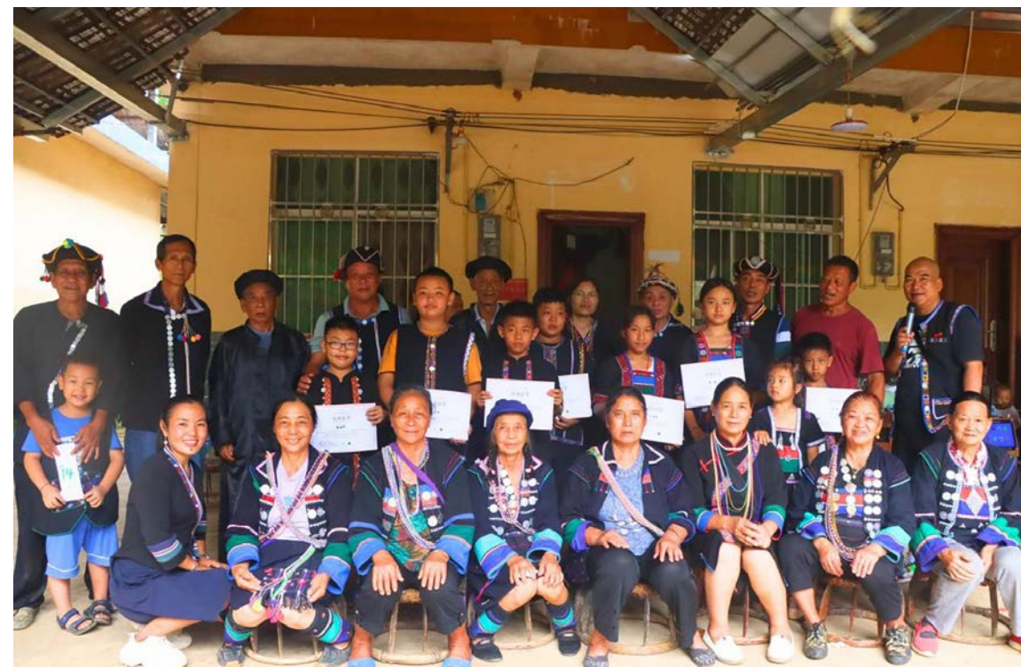
巩丙新村组织孩子们系统学习阿卡传统文化，学习结束后颁发证书

除了同族的认同，项目团队也希望借助阿卡文化以外的视角，协助村民看到自身文化的价值。2023 年，巩丙新村五位村民受邀参加昆明植物所举办的“山地未来”国际会议，并分享巩丙以文