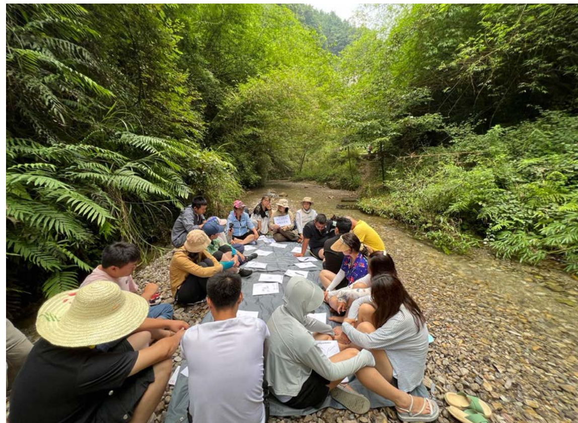
巡河领队参加户外现场教学

这种“地方感”的唤醒与深化，也是黔仁生态和社区伙伴共同的着力点。社区伙伴相信，内在力量源自内心与大自然的连接，尤其是身边的大自然。要建立这种连接，除了知识和理论学习之外，还需要发展用心去体会和感知的能力。对此，黔仁生态也尝试跳出污染监督的固有框架，和巡河领