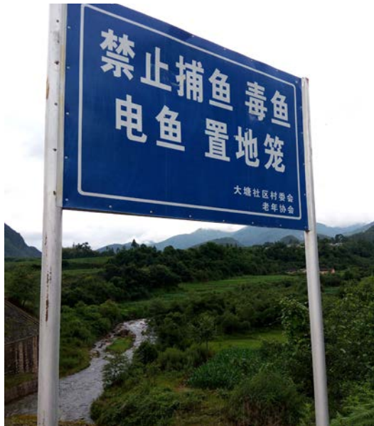
大塘鱼类保护宣传

老年协会进一步启发社区认识到，自然万物息息相关，除了鱼类，还要保护山林和鸟兽、昆虫等，只有全方位的保护才能最终保护好鱼类。大塘社区根据国家法律制定了自己的保护规章制度，涉及山林、河流、鱼类保护以及环境卫生等方方面面。老年协会制作保护手册分发到各家各户，并在当地小学开展生物多样性保护教育，推动保护成为家庭生活中的寻常话题；还在村旁和桥边设立了13块宣传牌，以提醒外来人员杜绝伤害鱼类的行为。如今，河流环境大为改善，毒鱼、电鱼和滥捕行为基本杜绝，鱼的数量也有所恢复；采挖砂石、乱伐树木等现象也不再发生，逐步形成了全社区共同参与保护的氛围。