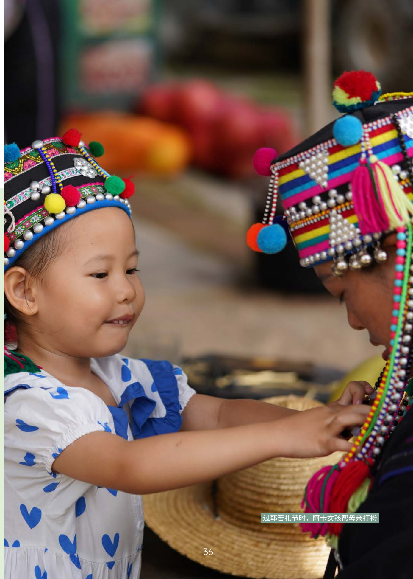
过耶苦扎节时，阿卡女孩帮母亲打扮

从2021年至今，中国科学院昆明植物研究所（以下简称“昆明植物所”）、昆明市呈贡区梦南舍可持续发展服务中心（以下简称“梦南舍”）在社区伙伴的支持下，与巩丙新村村民共同探索民族传统文化与生物多样性保护及日常生活的关系，并在阿卡文化基础上开展多方力量参与的生态功能区与村落生态观修复行动。如今，村寨的面貌及周边雨林都在发生变化，阿卡文化对于生态保护以及调适人与自然关系的价值也越来越被了解和认可。更重要的是，关于传统文化如何传承并有益于社区发展、有益于生态文明建设，各方都有了更多体会和思考。