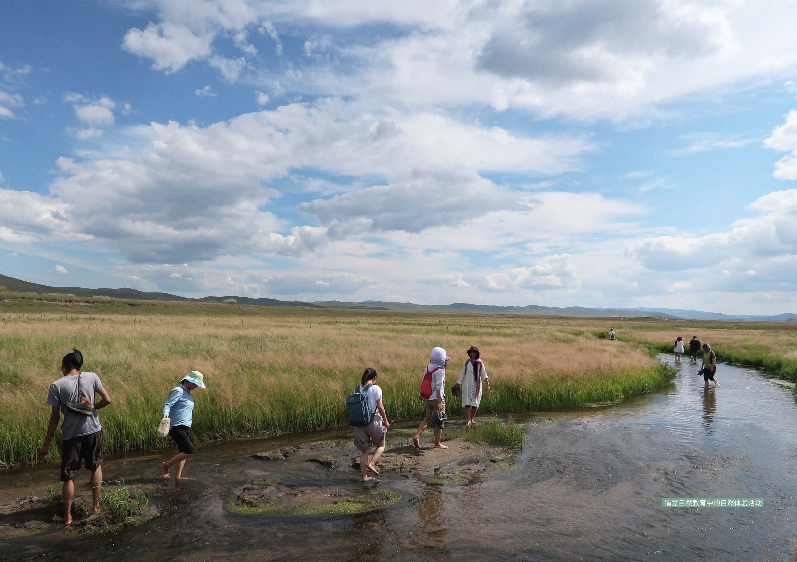
情意自然教育中的自然体验活动